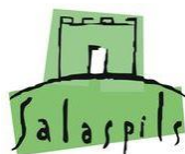
Salaspils novada pašvaldība